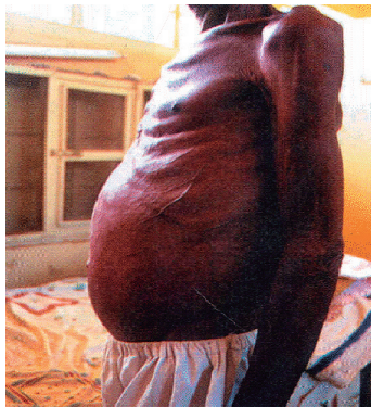
Figura 1. Ilustração apresentada no livro de Ciências (Favalli et al., 2009), acompanhada da legenda “Pessoa com esquistossomose”.

Em todos os livros analisados, está evidente um forte apelo visual, característica considerada importante pelos professores (Silva et al., 2006). Nestes materiais, predomina a utilização de imagens, sem a devida exploração de sua capacidade de mobilização, tornando esses recursos pouco relevantes no processo de aprendizagem. Um aspecto importante é o enfoque que dão algumas ilustrações ao grotesco, presente principalmente na retratação do doente (Figura 1). Os autores utilizam uma imagem forte sem apresentar, no texto, elementos que justifiquem o quadro clínico demonstrado. Optam ainda por generalizar a doença ao legendar a imagem apenas com a frase “pessoa com esquistossomose”, ignorando o quadro crônico apresentado. Esta abordagem acaba por reificar e estigmatizar a figura do doente, além de incutir os sentimentos de horror e medo que impedem o desenvolvimento de um senso crítico necessário à aprendizagem (Pimenta et al., 2007).